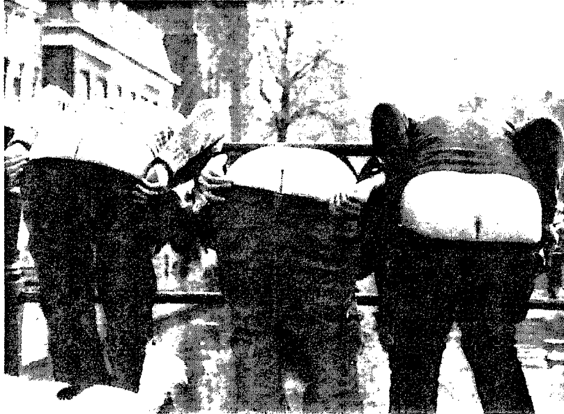
M'n reet.

'Wij danken u voor het applaus en de bloemen', zei de vice-voorzitter.