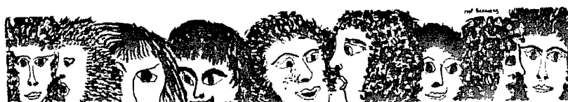
Uit Paarse September nr. 3, maart 1973